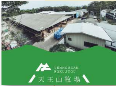
神戸市西区神出町にある天王山牧場。