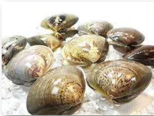
活はまぐりの鉄板焼き ¥1,200(¥1,320)