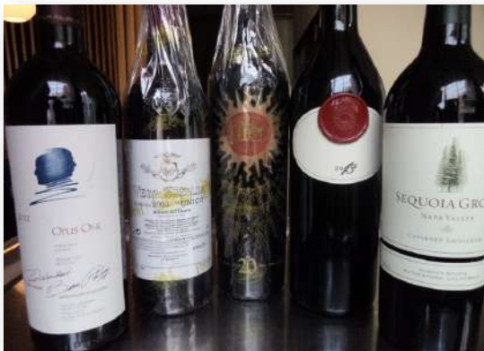
ワインも各種ご用意!