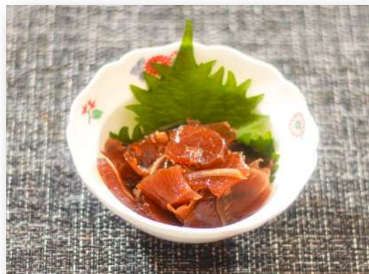
アキレスのポン酢あえ ¥800(¥880)