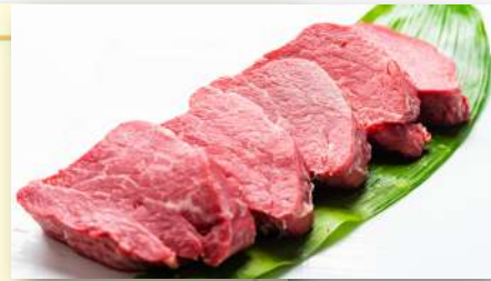
天王山牧場では、自家産牛「天王山牛(交雑種)」を肥育しています。こだわりぬいた肉質が生む、深い旨味とあっさりとした食べ応えが特徴です。

S<100g> ¥6,800(税込¥7,480) M<150g> ¥9,100(税込¥10,010)