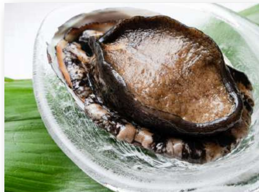
国内産あわび鉄板焼き or 刺身 ¥8,000~(¥8,800~)