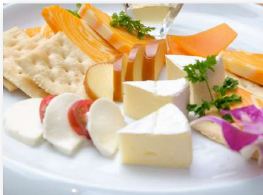
チーズの盛り合わせ ¥1,500(¥1,650)