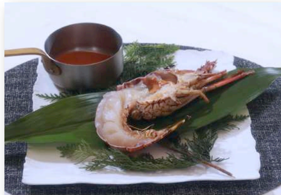
ロブスターの鉄板焼き(半身) ¥3,400(¥3,740)