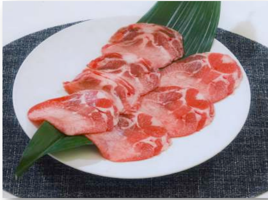
黒毛和牛 タンステーキ(薄切り) ¥2,400(¥2,620)