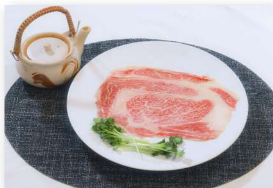
牛ロース肉のしゃぶしゃぶステーキ ¥2,200(¥2,420)