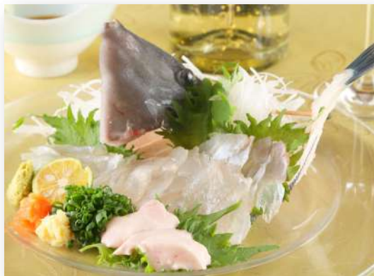
水槽内の魚のお造りできます。