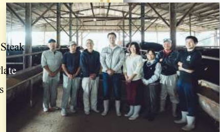
天王山牛を大切に育てる天王山牧場のスタッフたち。

S<100g> ¥11,000(税込¥12,100) M<150g> ¥13,300(税込¥14,630)