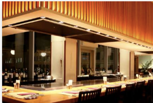
神戸の夜を素敵なディナーで♪