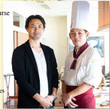
天王山牧場の戸田社長と弊社木田代表。