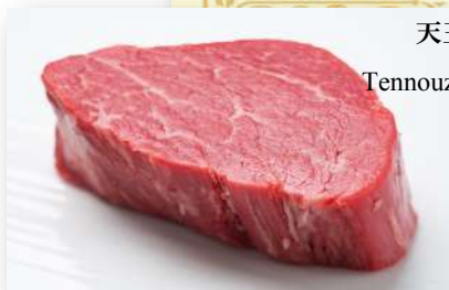
地産地消の最高級牛肉。

S<100g> ¥7,800(税込¥8,580) M<150g> ¥10,100(税込¥11,110)