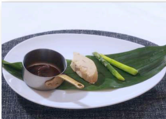
フォアグラの鉄板焼き ¥2,200(¥2,420)