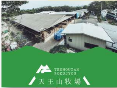
神戸市西区神出町にある天王山牧場。