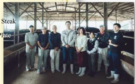
天王山牛を大切に育てる天王山牧場のスタッフたち。

※お肉の増量は10g単位で承ります。¥460(税込¥506)/10g Increase in the amount of meat are available in 10g ¥460 (including tax ¥506)/10g