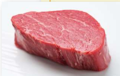
地産地消の最高級牛肉。