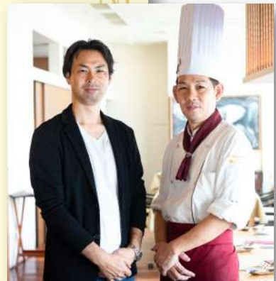
天王山牧場の戸田社長と弊社木田代表。